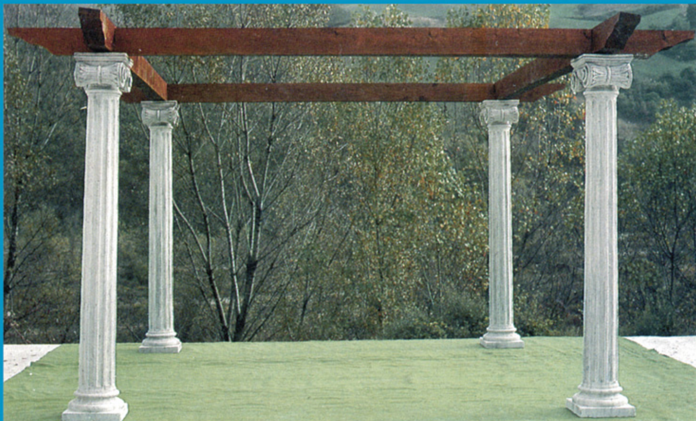
ART. 250 Esempio di Gazebo NERVANO in cemento tra + col.

Realizzato con: n. 4 colonne NERVANO h cm. 210x32x32 - kg. 180 n. 4 travi NERVANO - lungh. cm. 360